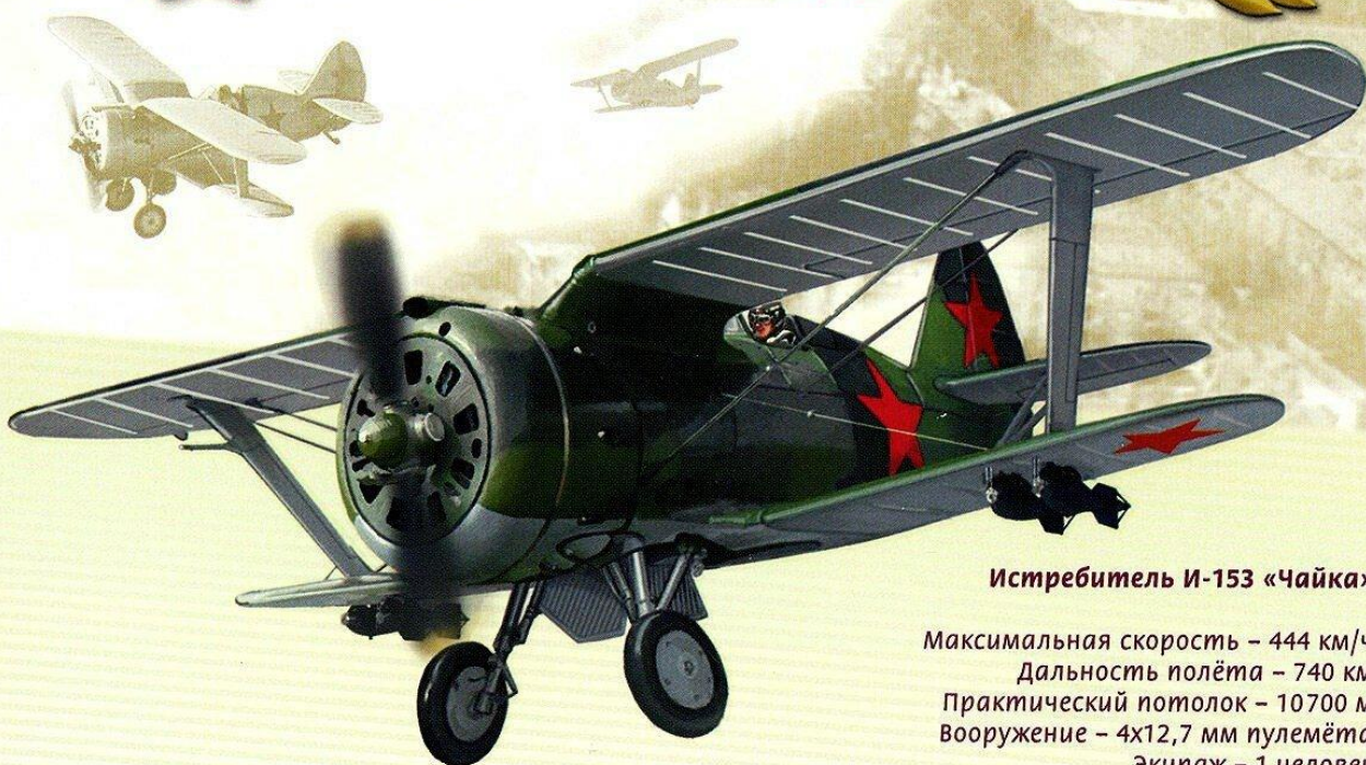
Истребитель И-153 «Чайка»

Максимальная скорость – 444 км/ч Дальность полёта – 740 км Практический потолок – 10700 м Вооружение – 4х12,7 мм пулемёта Экипаж – 1 человек