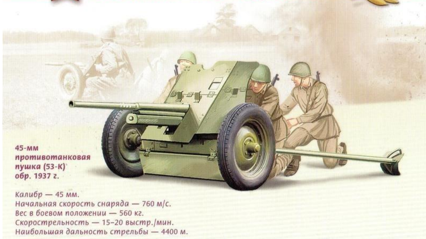
45-мм противотанковая пушка (53-К) обр. 1937 г.

Калибр — 45 мм. Начальная скорость снаряда — 760 м/с. Вес в боевом положении — 560 кг. Скорострельность — 15-20 выстр./мин. Наибольшая дальность стрельбы — 4400 м.